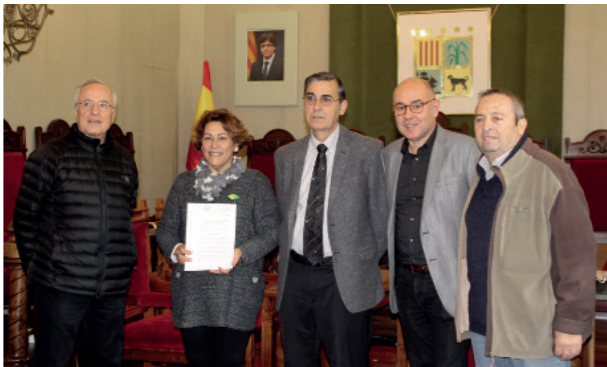
El govern i el Bisbat van oficialitzar la compra

El consistori ha fet efectiva la compra de l'edifici del Centre Parroquial al Bisbat de Girona. Han estat dos anys de converses que han culminat amb la compra de l'edifici que s'ubicava al conegut popularment com a "El Centru", juntament amb el local social de la planta superior i la rectoria nova.