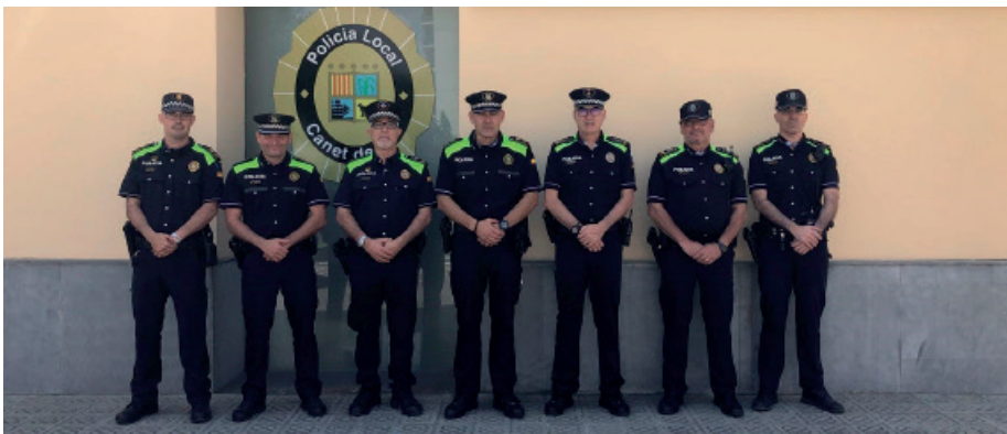
El cap d'Arenys de Munt, el sotscap de Canet, els caps de Sant Pol, Canet, Calella i el cap i sotscap d'Arenys de Mar (d'esquerra a dreta a la imatge) després de la primera reunió amb els uniformes

Des d'aquest estiu, el cos de la Policia Local vesteix d'acord amb la nova uniformitat, sorgida arran del procés d'homogeneïtzació dels uniformes dels 215 cossos de policia local de Catalunya en un sol model. Aquest canvi permet crear una imatge corporativa comuna als diferents cossos de policia de Catalunya, ja que és molt similar a la nova uniformitat del cos dels Mossos d'Esquadra.