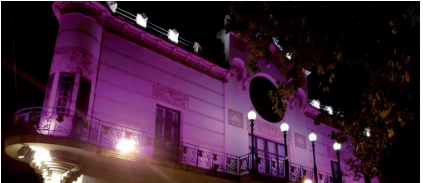
La façana de la biblioteca, il·luminada de rosa contra la violència de gènere

El municipi s'ha adherit a la jornada del 25-N, Dia Mundial de l'Eliminació de la Violència Contra les Dones amb un ampli ventall d'activitats que han tingut un bon seguiment: xerrades, tallers d'autodefensa i la projecció d'una pel·lícula han estat algunes de les més destacades.