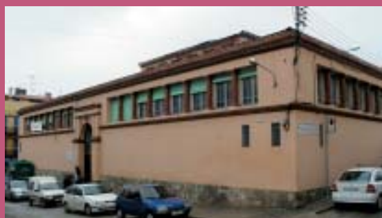
La Plaça Mercat

del Pinar i l'avinguda Marià Serra. La ronda Dr. Anglès - que fins no fa gaire anys comptava amb un bon tram sense asfaltar- està destinada a convertir-se en el principal eix circulatori de Canet, sobretot pel que fa al trànsit de vehicles pesants. D'aquesta manera, quan la ronda del Dr. Manresa estigui del tot urbanitzada i connectada amb la zona del Grau, Canet comptarà amb un cinturó de circumval·lació que rodejarà el municipi des de la ronda Anselm Clavé a la ronda Sant Elm, passant per l'autopista, i sense necessitat de circular per tot l'entramat urbà.