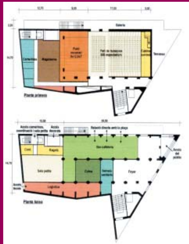
Plànol d'una de les alternatives del projecte d'usos de l'Odèon.