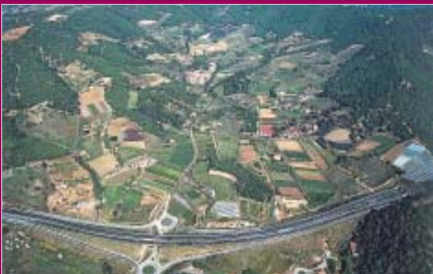
Ubicació del polígon industrial.