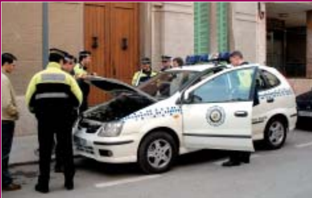
Agents de la Policia Local amb el nou vehicle policial.

* les xifres en euros i els percentatges s'han arrodonit, per això, la suma total és de 95,8%.