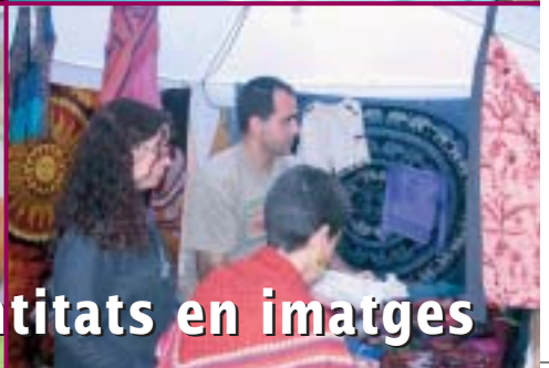
1a edició de la Mostra d'Entitats en imatges