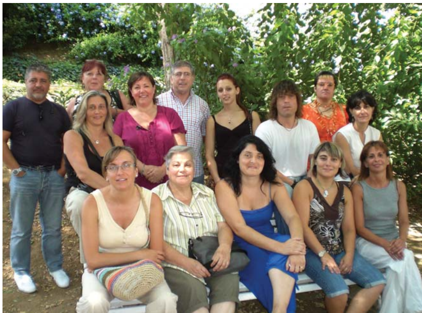
Alumnes del curs d'anglès de Promoció Econòmica

La llar d'infants municipal ha disminuït el número de places, ja