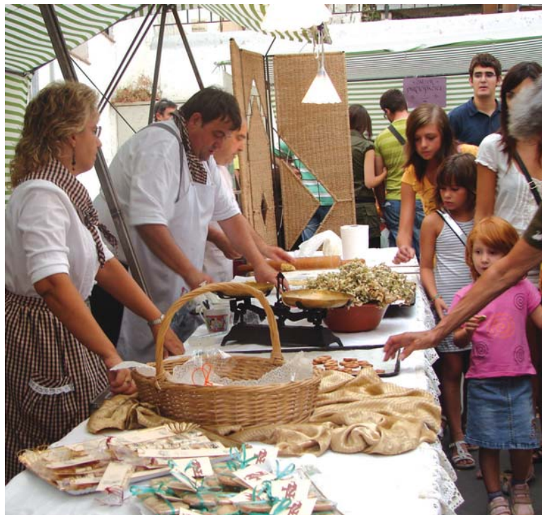
Pastissers fent vitralls