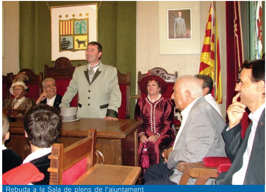
Rebuda a la Sala de plens de l'ajuntament