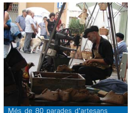
Més de 80 parades d'artesans