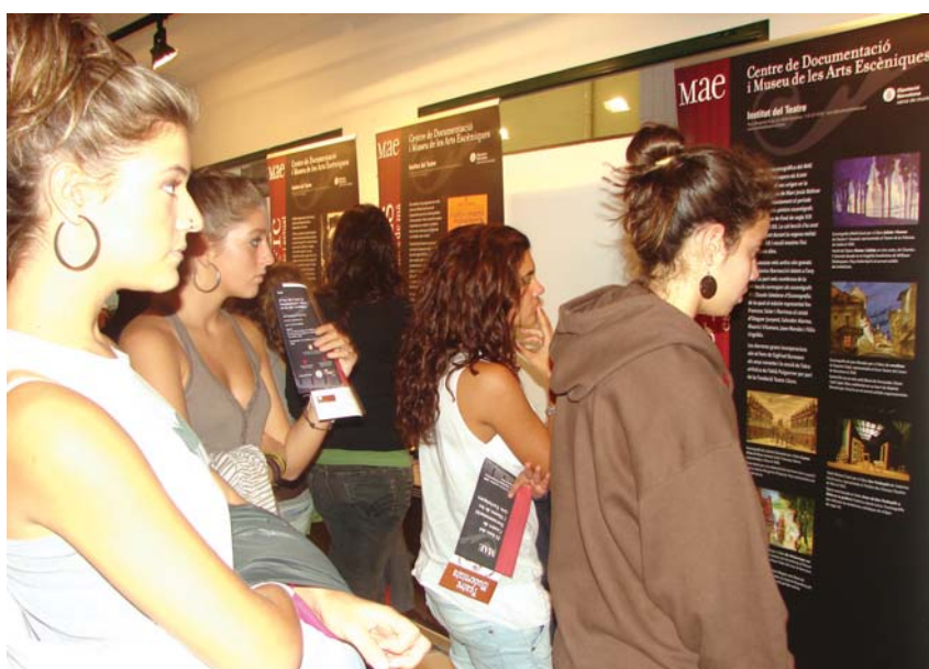
Alumnes del Batxillerat d'Arts Escèniques visiten l'exposició del MAE

Els centres docents de Canet han matriculat, aquest curs 2009-2010 un centenar d'alumnes més que el curs passat