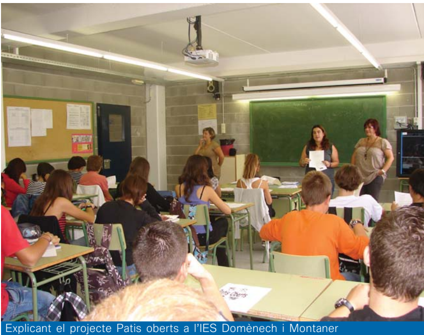
Explicant el projecte Patis oberts a l'IES Domènech i Montaner

molt important de sortides culturals i assistència a xerrades mensuals i conferències específiques.