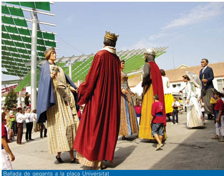
Ballada de gegants a la plaça Universitat

La jornada va servir per posar sobre la taula la realitat de pobles i ciutats i els reptes de futur que plegats es plantegen. S'hi van poder conèixer experiències forànies, com els mercats Old Spitalfield Market de Londres, el Mercat d'Aubagne de França o el Dappermarkt Market d'Amsterdam.