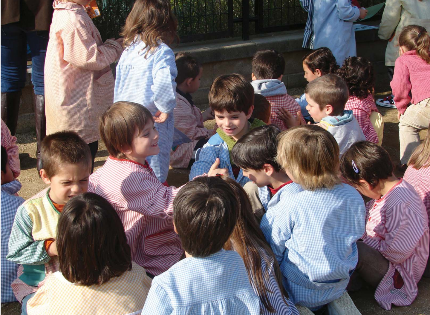
Alumnes de l'Escola Misericòrdia