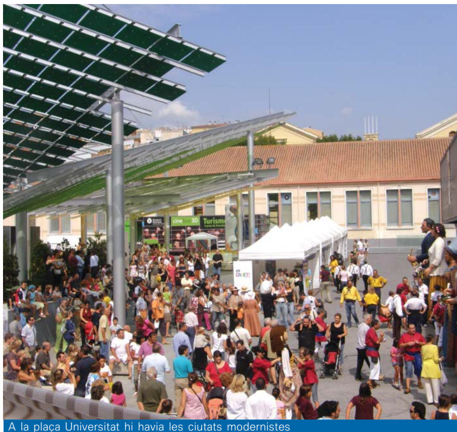
A la plaça Universitat hi havia les ciutats modernistes