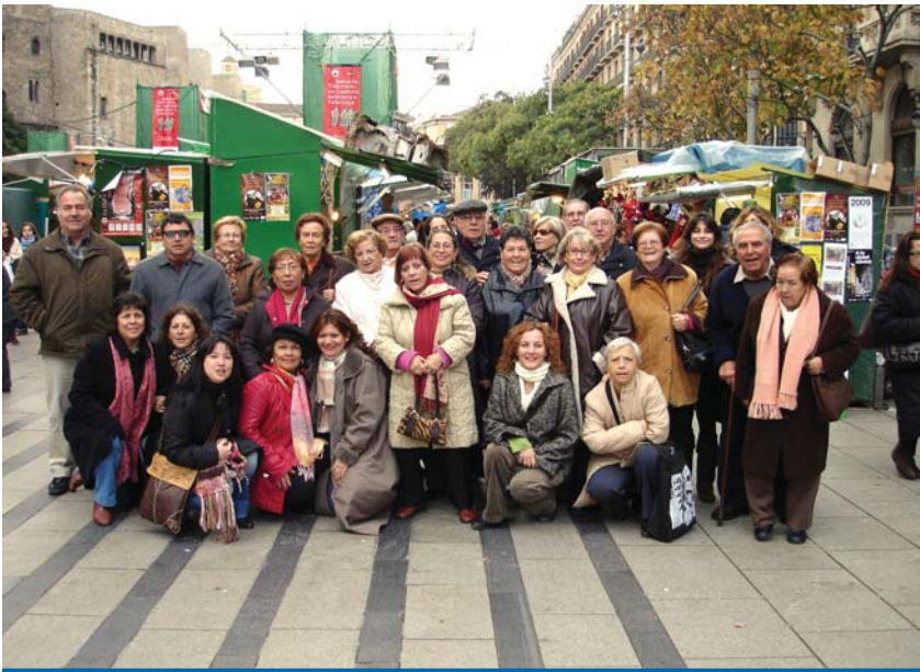
Sortida dels alumnes de l'Escola d'Adults Curs 2008-2009