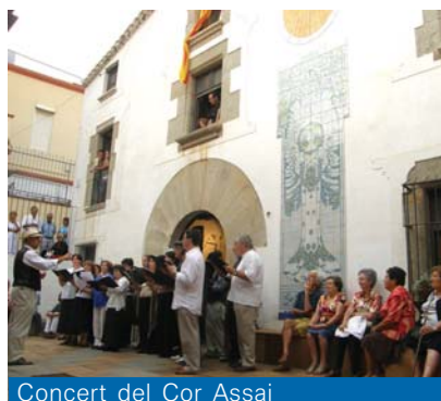
Concert del Cor Assai