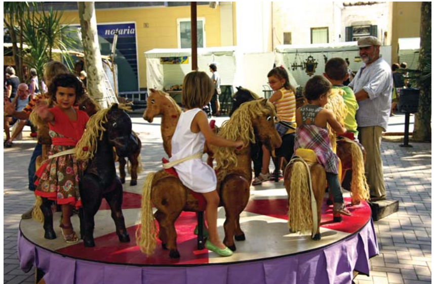
Una fira també pensada per als més petits

Al web municipal trobareu un ampli recull de les millors imatges que ens ha deixat la Fira. Aquí en teniu un petit tast.