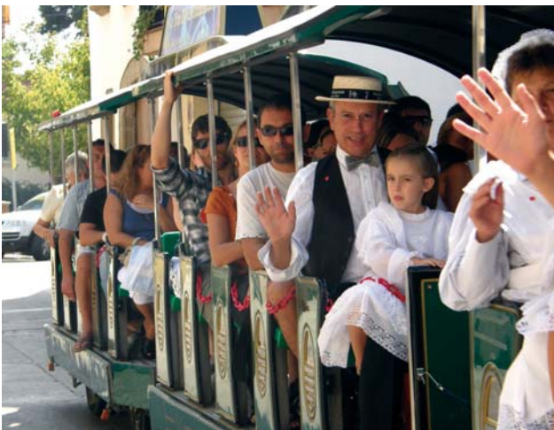
Amb trenet cap al castell