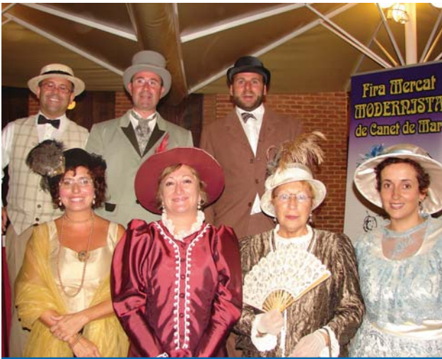
Els regidors i les regidores, vestits d'època