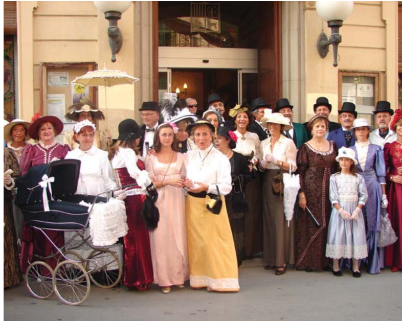
A punt per a la inauguració