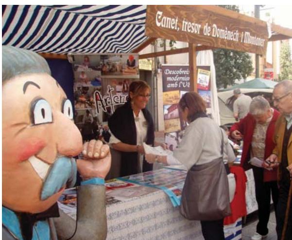
L'Ajuntament a la VIII Fira Modernista de Terrassa