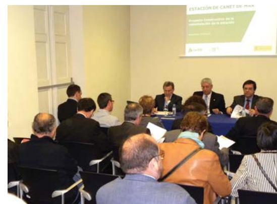
L'alcalde entre el delegat del Govern i el president d'ADIF

Les obres començaran aquest estiu i la durada prevista és de 8 a 9 mesos. No s'haurà de tallar el pas de trens perquè es procurarà treballar de nit, sense destorbar el descans dels veïns.