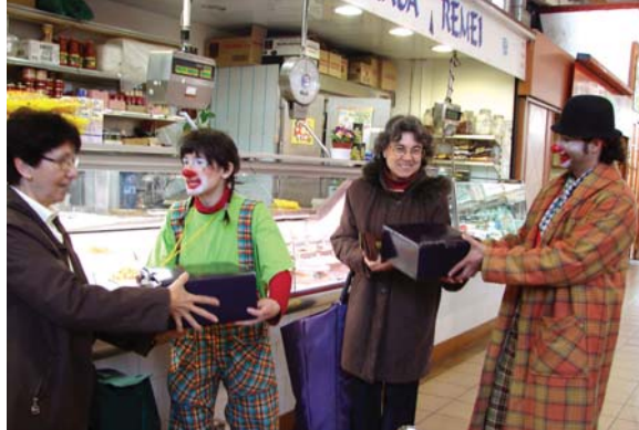
A l'abril es va fer una campanya de foment de l'ús del cabàs